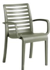
Forest Green U6 301 818