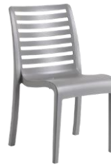
Gris Platinum U6 401 289