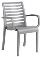
Gris Platinum U6 301 289