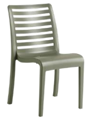
Forest Green U6 401 818

Conforme aux normes européennes EN 581 1/2/3 : produit testé en sécurité, résistance et stabilité pour un usage collectif.