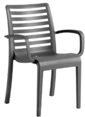
Anthracite U6 301 002