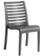
Anthracite U6 401 002